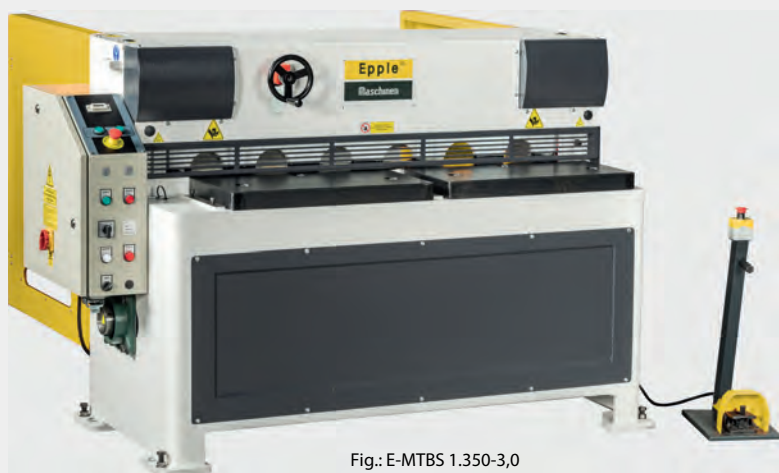
Fig.: E-MTBS 1.350-3,0

Cisailles guillotines motorisées pour la découpe de tôle allant jusqu'à 4 mm d'épaisseur en acier doux. Le moteur, le système de freinage avec le système de refroidissement permettent un fonctionnement silencieux.