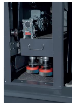
Image : Module à brosse