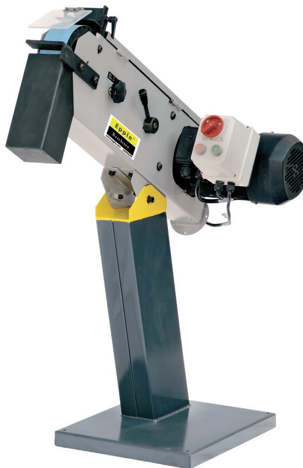
FIG.: BSM 75-2