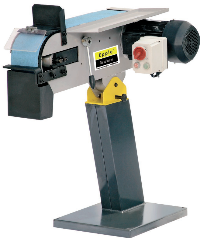
FIG.: BSM 150-2