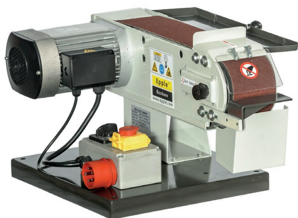
FIG.: TBSM 100-2