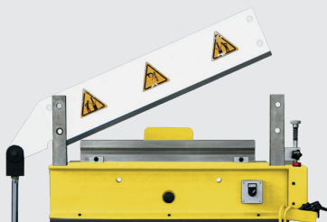
PIC: OUTIL SUPÉRIEUR REPLIÉ