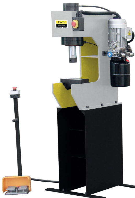
FIG: HWP-E 25