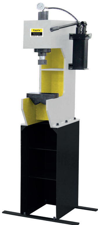
FIG: HWP 16