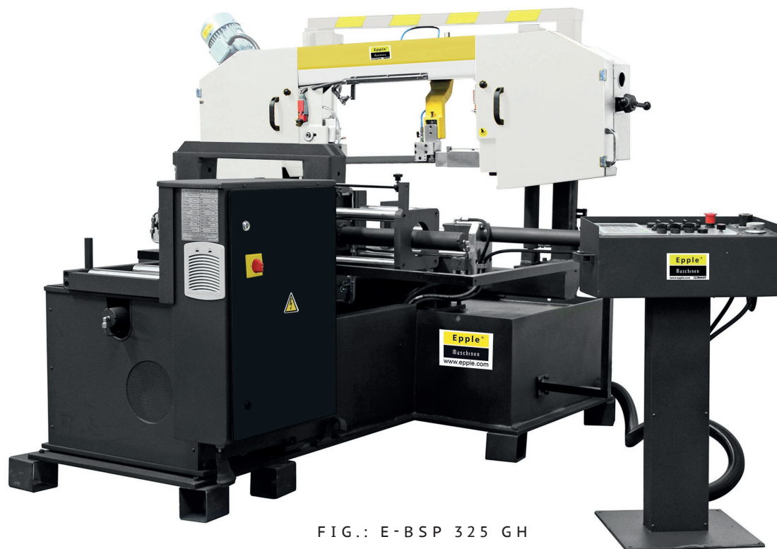
FIG.: E-BSP 325 GH