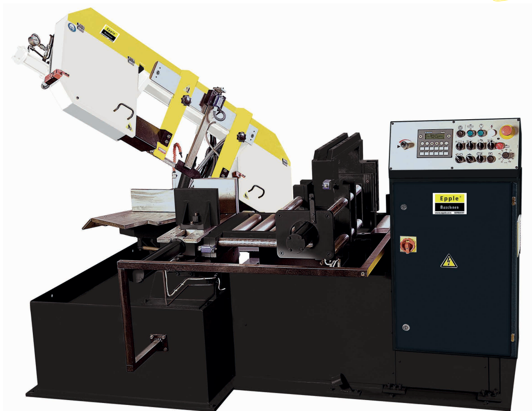
FIG.: E-BS 320 GV