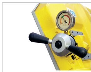
Dispositif de tension du ruban