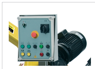
Panneau de commande orientable